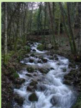
Regato do Batán