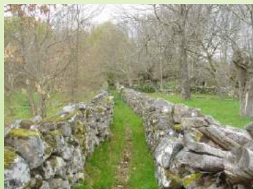
"Carriosa" en Fondodevila