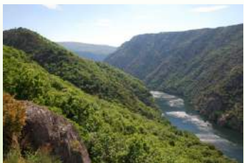
Canón do Sil dende o miradoiro da Galiña